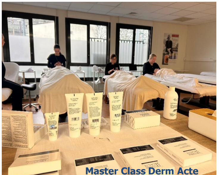
Master Class Derm Acte