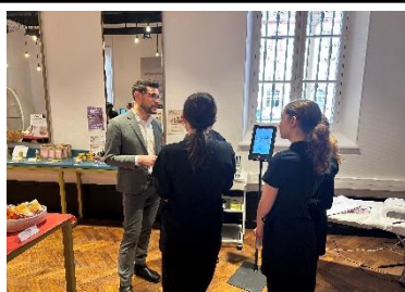
Diagnostic de peau numérique avec IA- Idiaq By Ieva