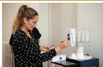
Création de « Ma Crème » sur mesure avec le IOMA Lab