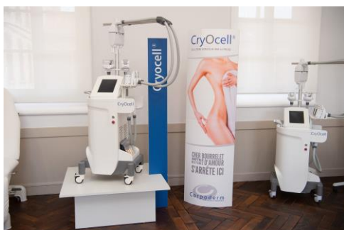
Le Showroom Hi-Tech Corpoderm

Séphora Chartres , Orléans, Rambouillet – Nocibé Chartres , Lucé - Beauty Success Paris, Le Mans –Une Heure pour Soi - Yves Rocher Chartres- Barjouvillle- Dreux- Rambouillet- Saran - Bénéfit Vélizy -Ioma, l'Atelier du Sourcil Paris – Marionnaud – Nocibé , Galeries Lafayette – Printemps –Body Minute -Matis – Institut d' Eve –The Body Expert – Qipao Chartres & Paris– KIKO Chartres – Rituals Chartres- Les Instituts traditionnels- CAP LASER Chartres Spa Cinq Mondes de la Samaritaine Paris - Spa du Crillon Paris – Spa Deep Nature Courchevel - Le Spa St Quentin By Sothys- Trianon Palace à Versailles Blue SPA Chartres --Escale Détente Chartres-- Le Chemin de l'Éveil Chartres- Spa du Castel de Maintenon -La Rumba Dreux -Spa O'Kari Paris –Les Starts Up de la Cité de l'Innovation - La Cosmetic Valley