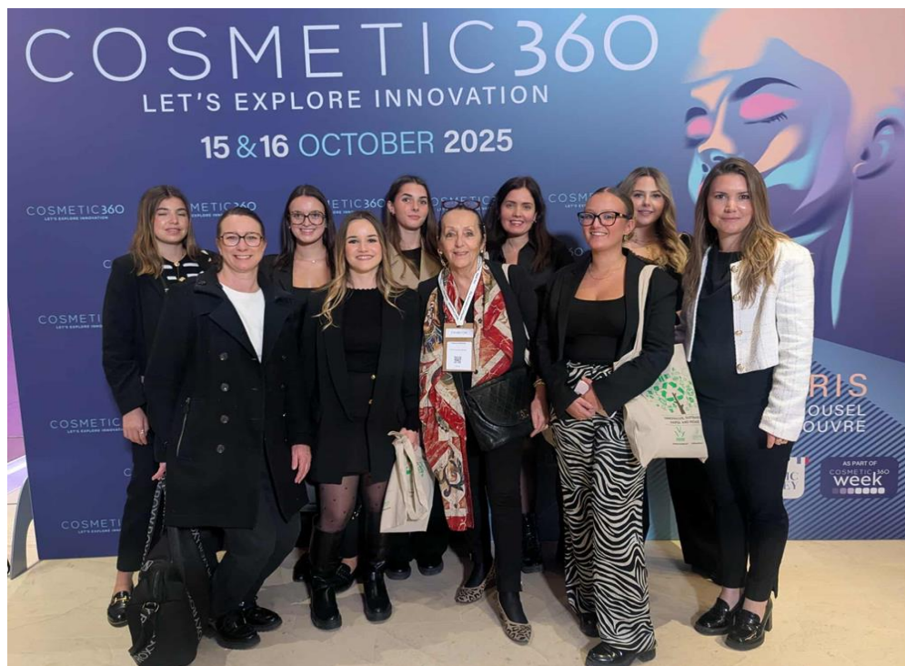
Octobre 2025 – Master Class au Cosmetic 306 – Carrousel du Louvre

L'alternance assurée par un ancrage puissant avec les grandes enseignes du marché