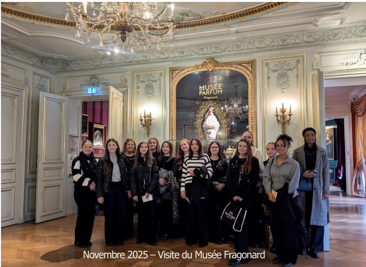
Novembre 2025 – Visite du Musée Fragonard

"Faites de votre vie un rêve et de vos rêves une vie"