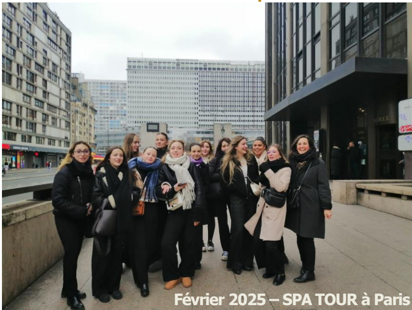
Février 2025 – SPA TOUR à Paris

Les modules de formation SPA & Wellness sont validés en contrôle continu et donnent droit à un Certificat de Compétence Professionnel