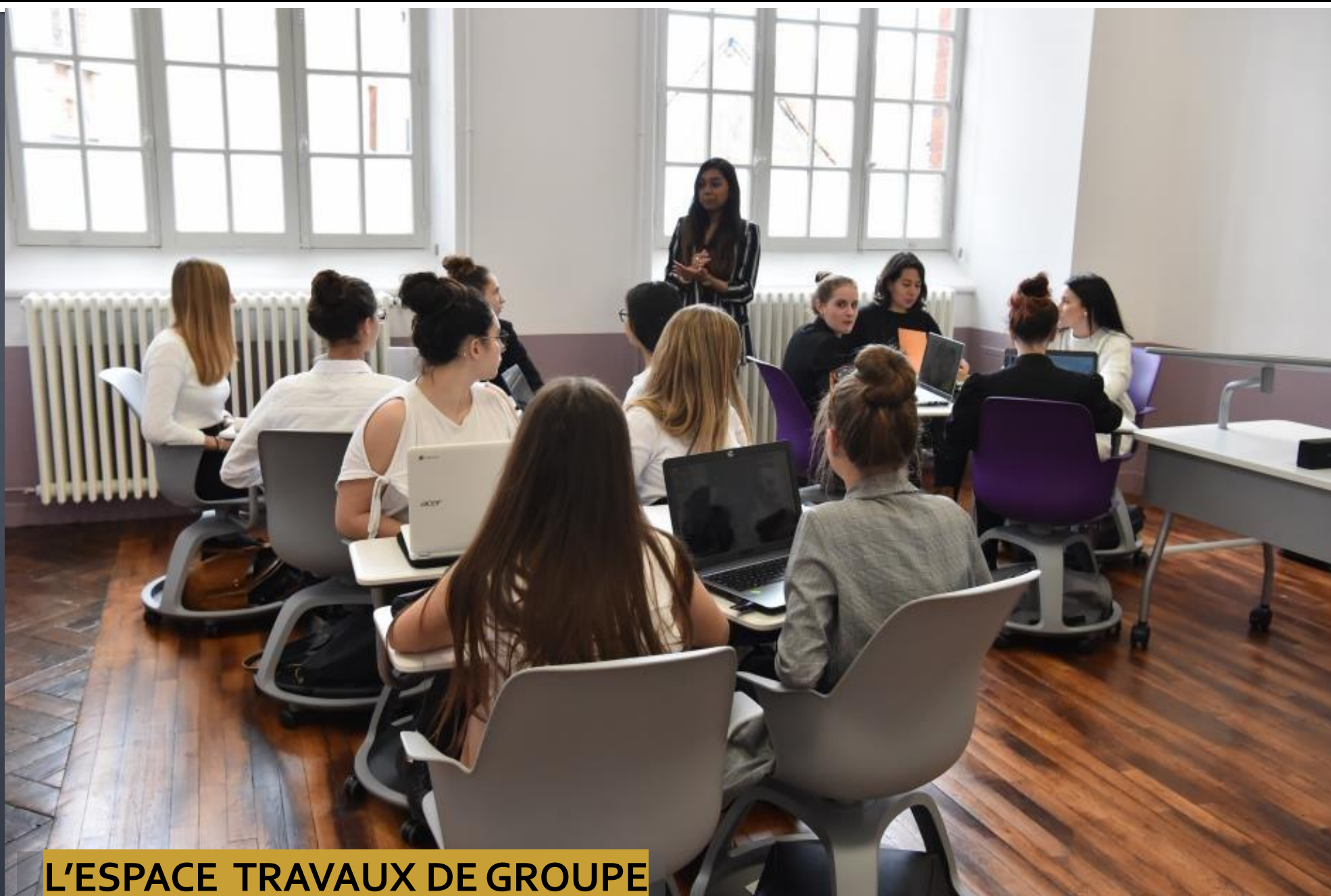
L'ESPACE TRAVAUX DE GROUPE

INTERNATIONAL BEAUTY & COSMETIC BUSINESS SCHOOL by Régine Ferrère