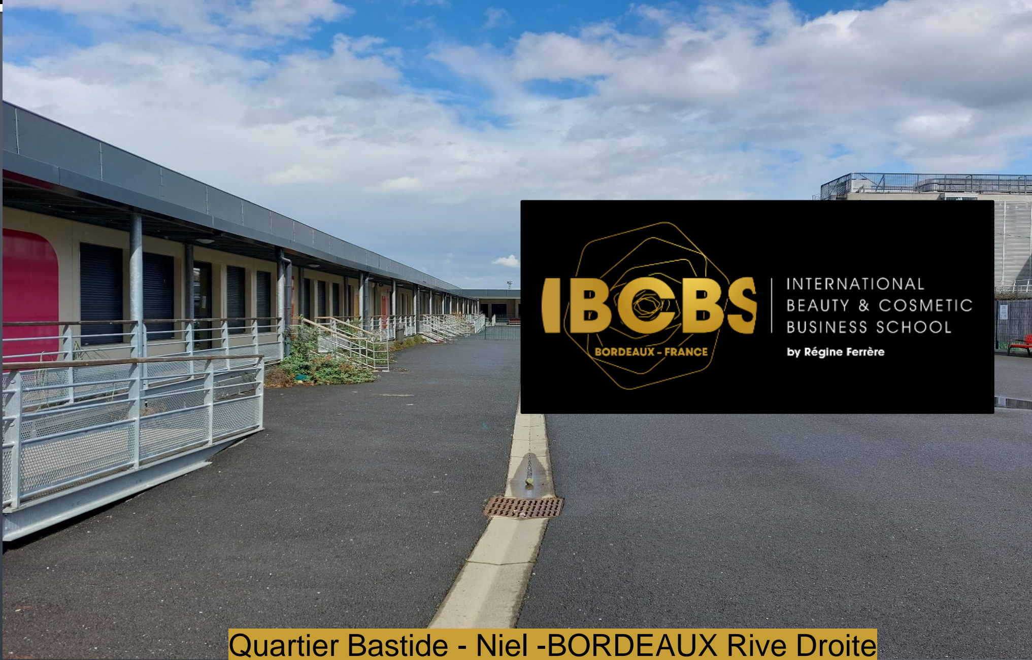
Quartier Bastide - Niel -BORDEAUX Rive Droite