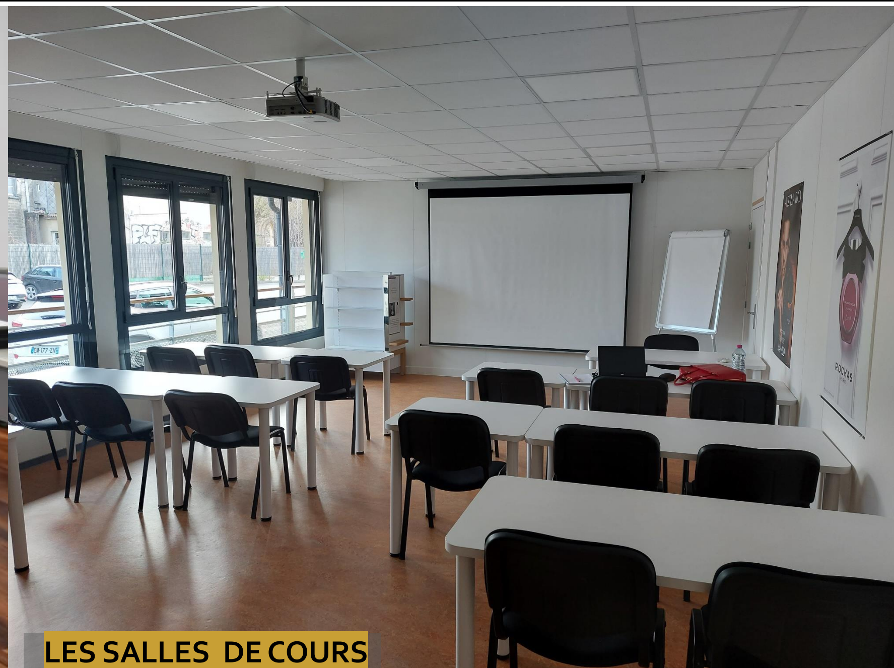
LES SALLES DE COURS