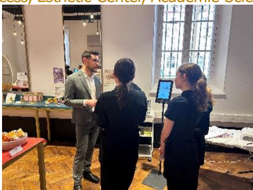
Diagnostic de peau numérique avec IA