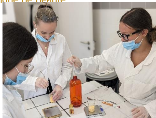
Travaux pratiques au Laboratoire